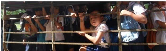
Ein überfüllter Bus bringt die Kinder in die Schule

In diesen abgelegenen und isolierten Bergregionen zu leben, bedeutet für die Gemeinschaften oft, dass sie vergessen werden, da die Umwelt als natürliche Barriere fungiert und sie von der Aussenwelt abschneidet. Da Infrastruktur und Strassen sehr rudimentär sind und die Gegend somit schwierig zu erreichen ist, gibt es nur sehr wenig Unterstützung für diese Gemeinden.