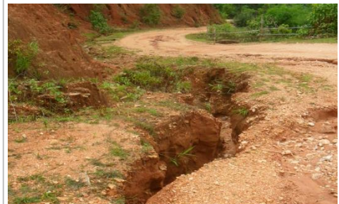
Schlechte Infrastruktur und Strassen