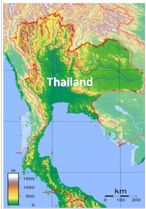
Bergiges Gelände im Norden Thailands

Kinder und Jugendliche zwischen 6 und 18 Jahren aus benachteiligten Gemeinschaften ethnischer Minderheiten und Familien, die nach Thailand geflohen sind, um dem Bürgerkrieg und der politisch instabilen Situation in Myanmar zu entkommen.