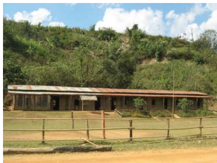
Schulgelände mit dem brüchigen Schulgebäude