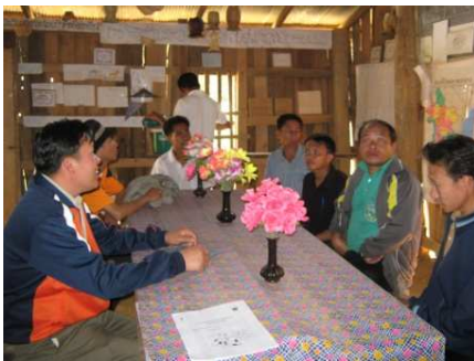
Diskussion mit den Dorfbewohner über das neue Gebäude