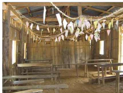
Eines der gegenwärtigen Schulzimmer