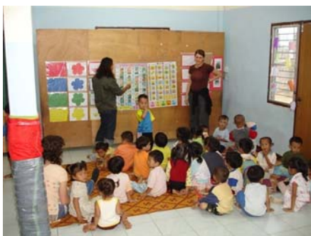
Unterricht in verschiedenen Sprachen