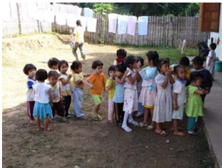
Anstehen fürs Mittagessen