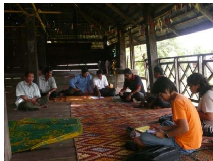
Dorfbewohner an der ersten Baubesprechung