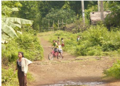
Auf der Strasse nach Gae Lae