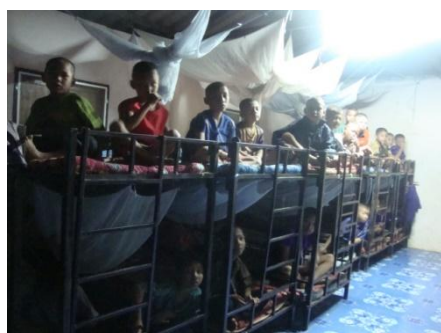
Schlechte Schlafbedingungen aufgrund stark überfüllter Schlafräume...