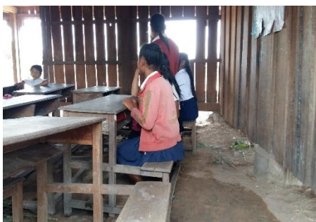
In der Regensaison sind die Klassenzimmer oft überschwemmt.