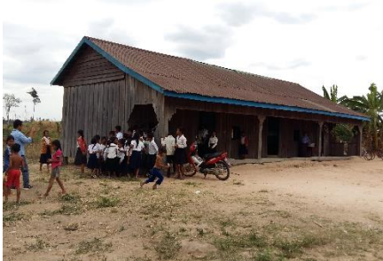
Willkommen in der Koki Chrum Primarschule