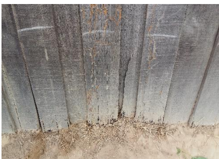
Die Holzwände sind morsch und brüchig. Auch die tragenden Balken sind verrottet.