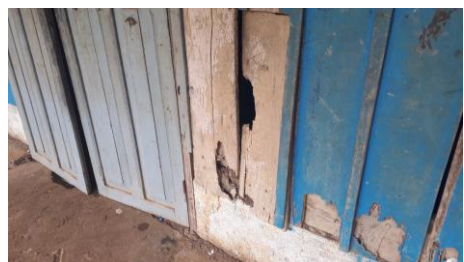
Die Wände und das Dach sind voller Löcher und machen das Gebäude sehr instabil