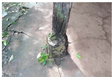
Morsche Pfeiler erhöhen die Einsturzgefahr massive und müssen ersetzt werden