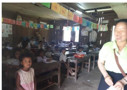
Eines der düsteren, verrotteten Schulzimmer mit rissigem Boden