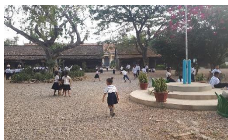
Das Schulgelände mit Schülern in der Pause, die vor den beiden Holzhäusern laufen. Das Betongebäude befindet sich auf der Rückseite.