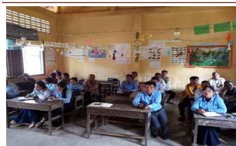
Unser lokales Team trifft sich mit dem Lehrpersonal, um das Projekt und die Zusammenarbeit in der Gemeinde zu besprechen.