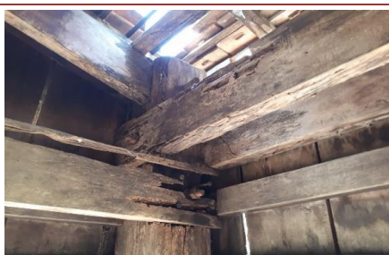
Die Holzpfiler und der Rahmen, der die gesamte Gebäudestruktur trägt, sind furchtbar verrottet.