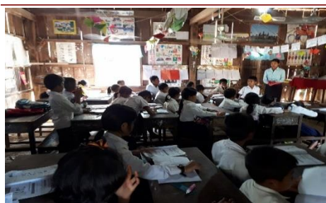
Das Innere eines Klassenzimmers in einem der Holzhäuser - eine instabile und düstere Umgebung.